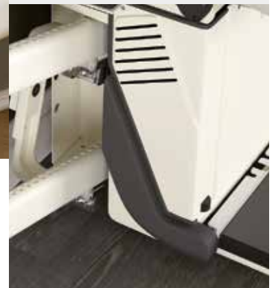
Apoya-piés y cuerpo de la máquina con sensores para una completa seguridad durante la utilización