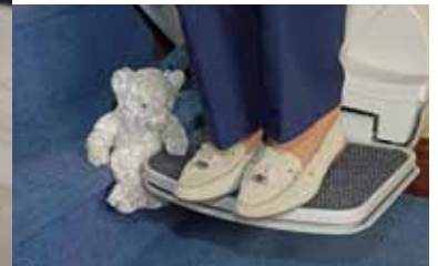
Reposapiés con bordes de seguridad antideslizantes