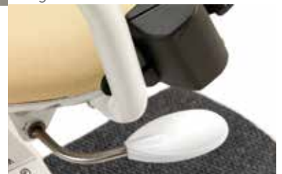
Cómoda barra para la rotación del asiento