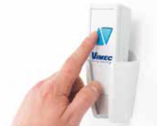
Telemando de nivel