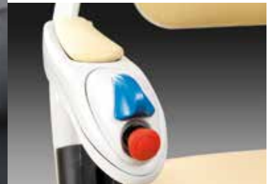
Palanca de mando