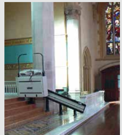
V64 con apertura automatizada