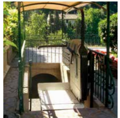
V65 con barras independientes