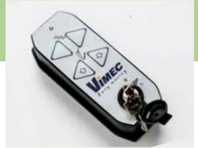
Mando via radio