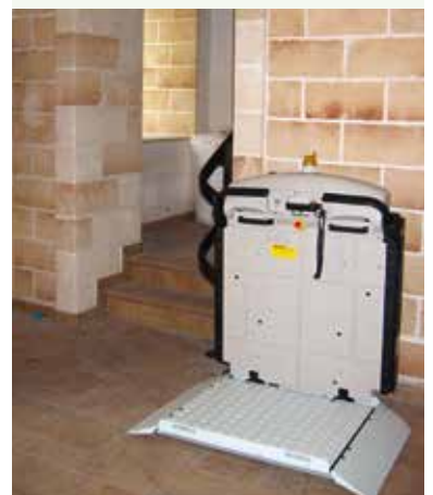
V65 con barras retractiles